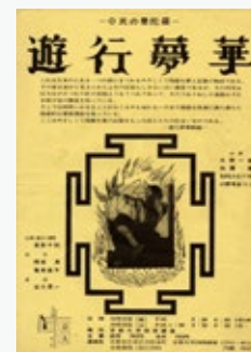
「O氏の曼陀羅」ちらし Mandala of Mr.O flyer