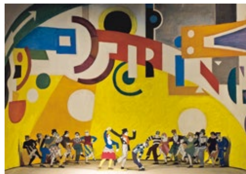
フェルナン・レジェによる舞台美術 / Fernand Léger's Scenography